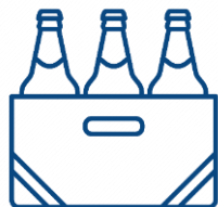
Пиво и пивные напитки